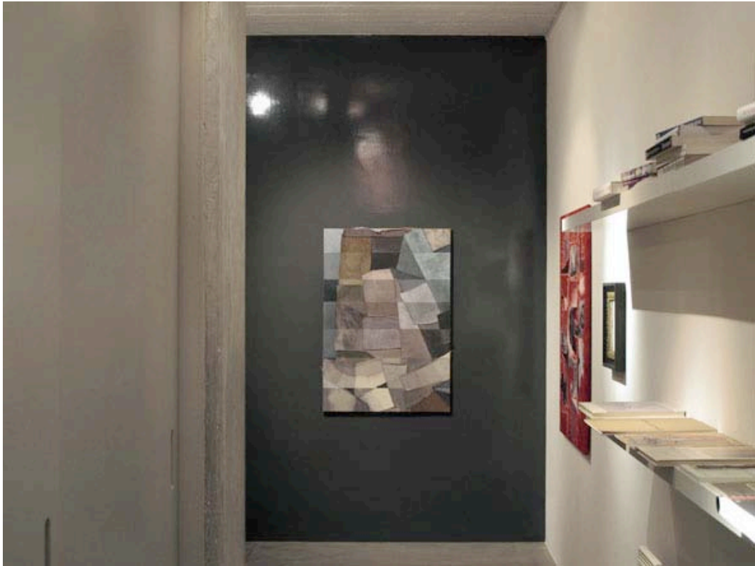
Vue de l'exposition