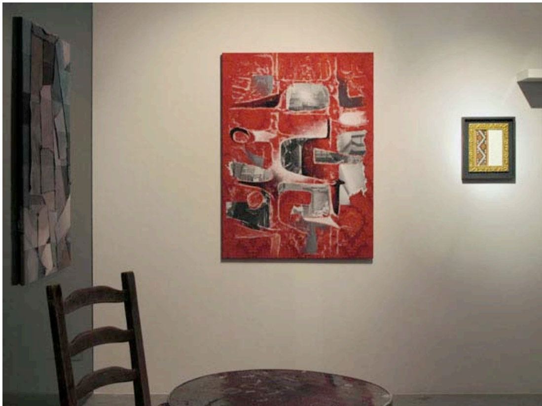
Vue de l'exposition, Sans titre et Double frame