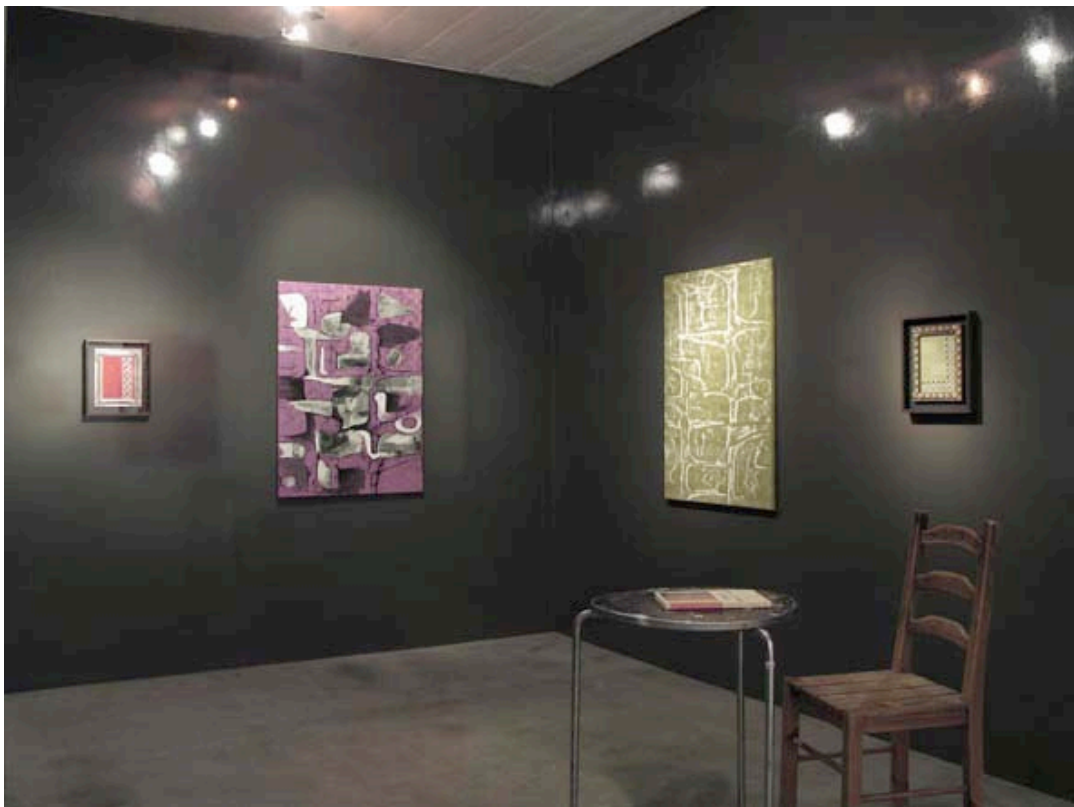
Vue de l'exposition, Sans titre et Double frame