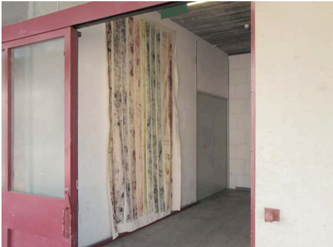
Vue de l'exposition, Tapisserie Freihafen , 2011, frottage, huile sur toile, 420 x 260 cm