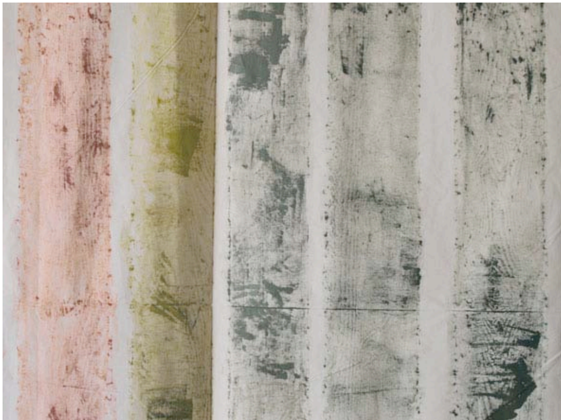
Tapisserie Freihafen , 2011, frottage, huile sur toile, détail