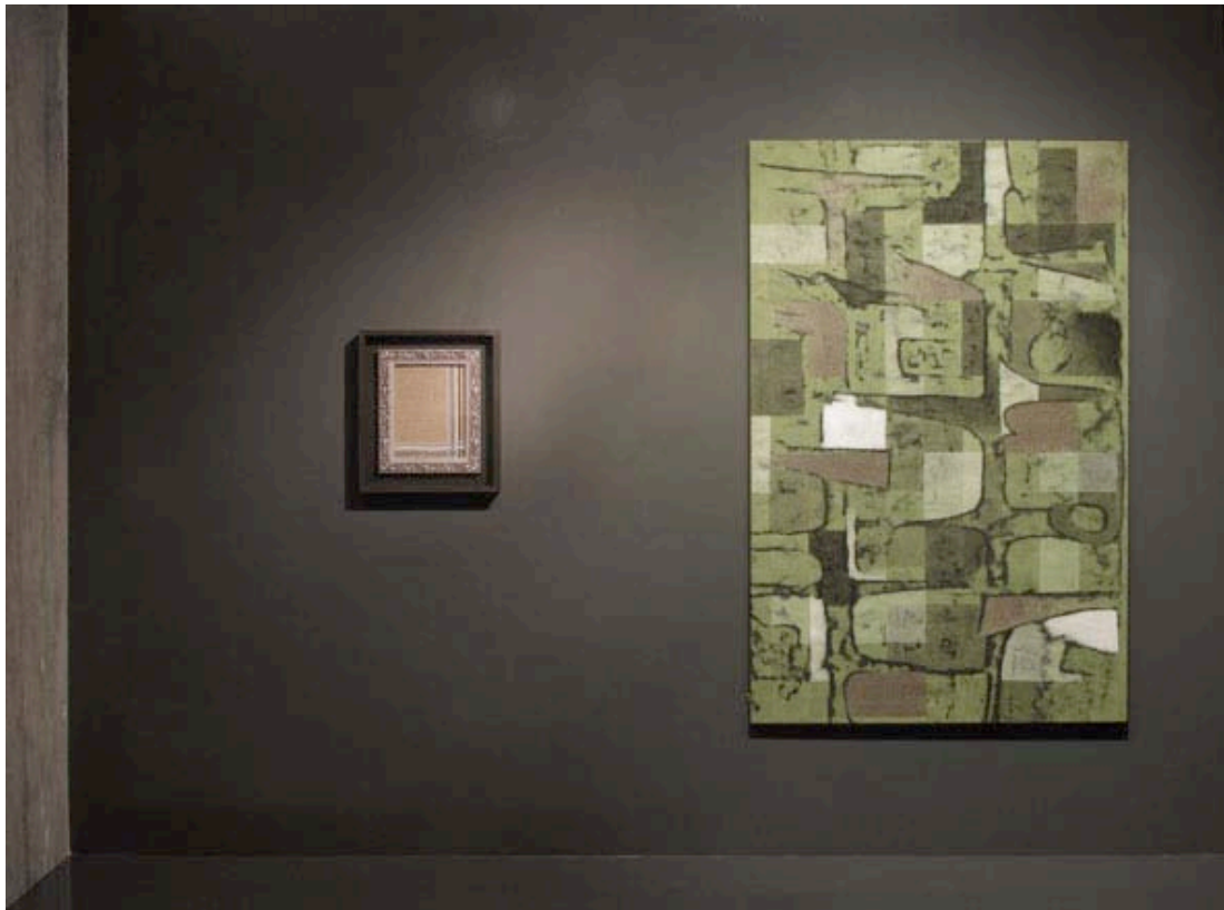
Vue de l'exposition, Sans titre et Double frame