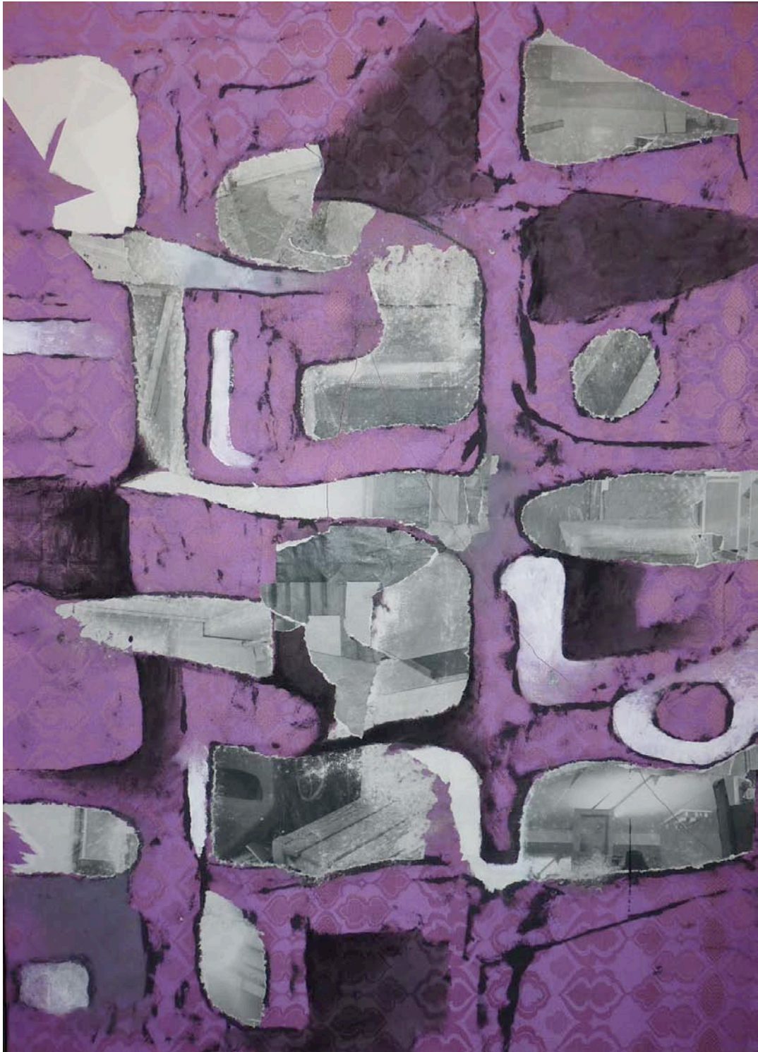
Sans titre, 2011, acrylique et papier collé sur tissu, 110 x 80 cm