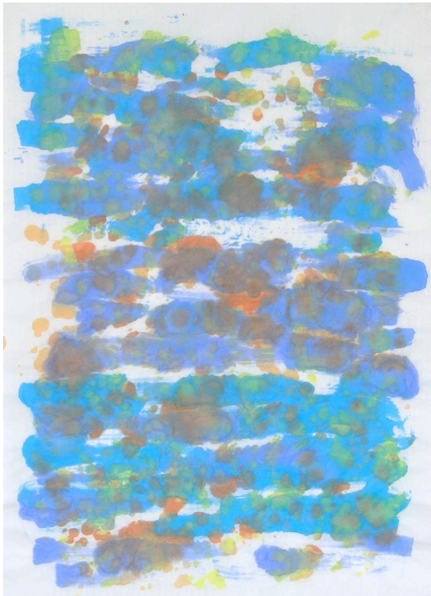
Johanna Abraham Sans titre 2012 Aquarelle sur papier soie