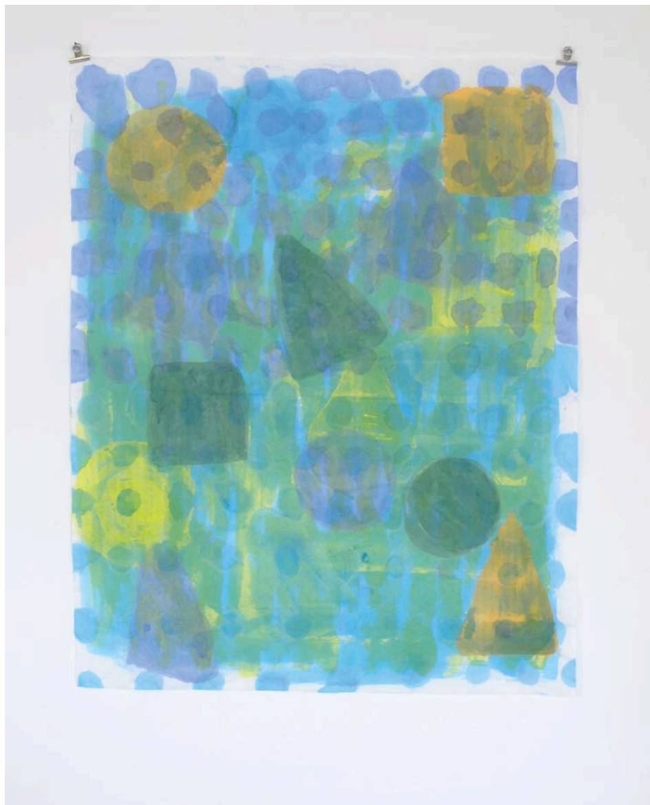
Johanna Abraham Sans titre 2012 Aquarelle sur papier soie